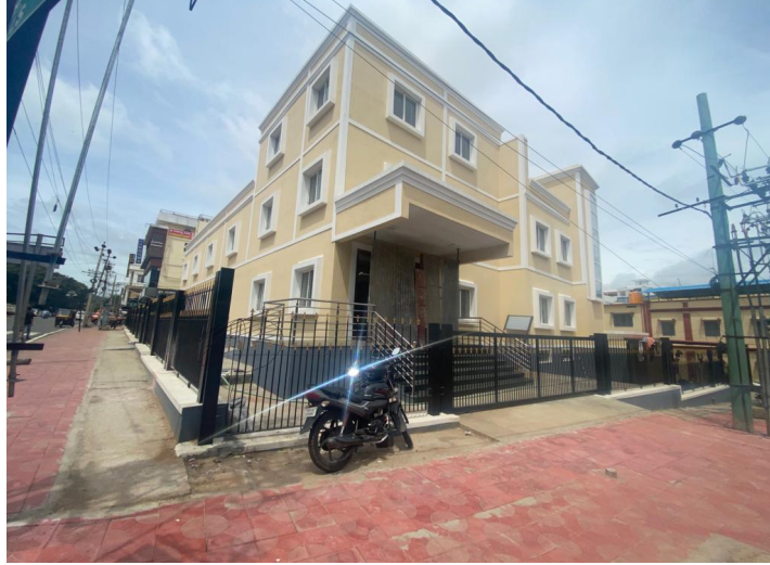
ಇಟ್ಟಿಗೆಗೂಡು ಲಿಂಗಣ್ಣ ವೃತ್ತದಲ್ಲಿನ ಪ್ರಾಧಿಕಾರದ ಕಛೇರಿ ಕಟ್ಟಡ

ಸದರಿ ಯೋಜನೆಯಡಿ ಒಟ್ಟು 47 ಕಾಮಗಾರಿಗಳನ್ನು ರೂ. 6741.04 ಲಕ್ಷಗಳ ಅಂದಾಜು ವೆಚ್ಚದಲ್ಲಿ ಕೈಗೆತ್ತಿಕೊಳ್ಳಲಾಗಿದ್ದು, ಇವುಗಳಲ್ಲಿ 06 ಕಾಮಗಾರಿಗಳು ಪೂರ್ಣಗೊಂಡಿದ್ದು, 09 ಕಾಮಗಾರಿಗಳು ಪ್ರಗತಿಯಲ್ಲಿದ್ದು ಹಾಗೂ 07 ಕಾಮಗಾರಿಗಳು ಟೆಂಡರ್ ಪ್ರಕ್ರಿಯೆಯಲ್ಲಿರುತ್ತದೆ.