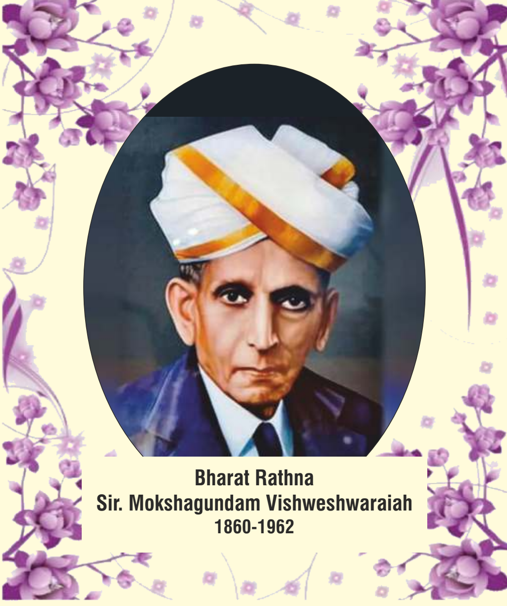
Bharat Rathna Sir. Mokshagundam Vishweshwaraiah 1860-1962