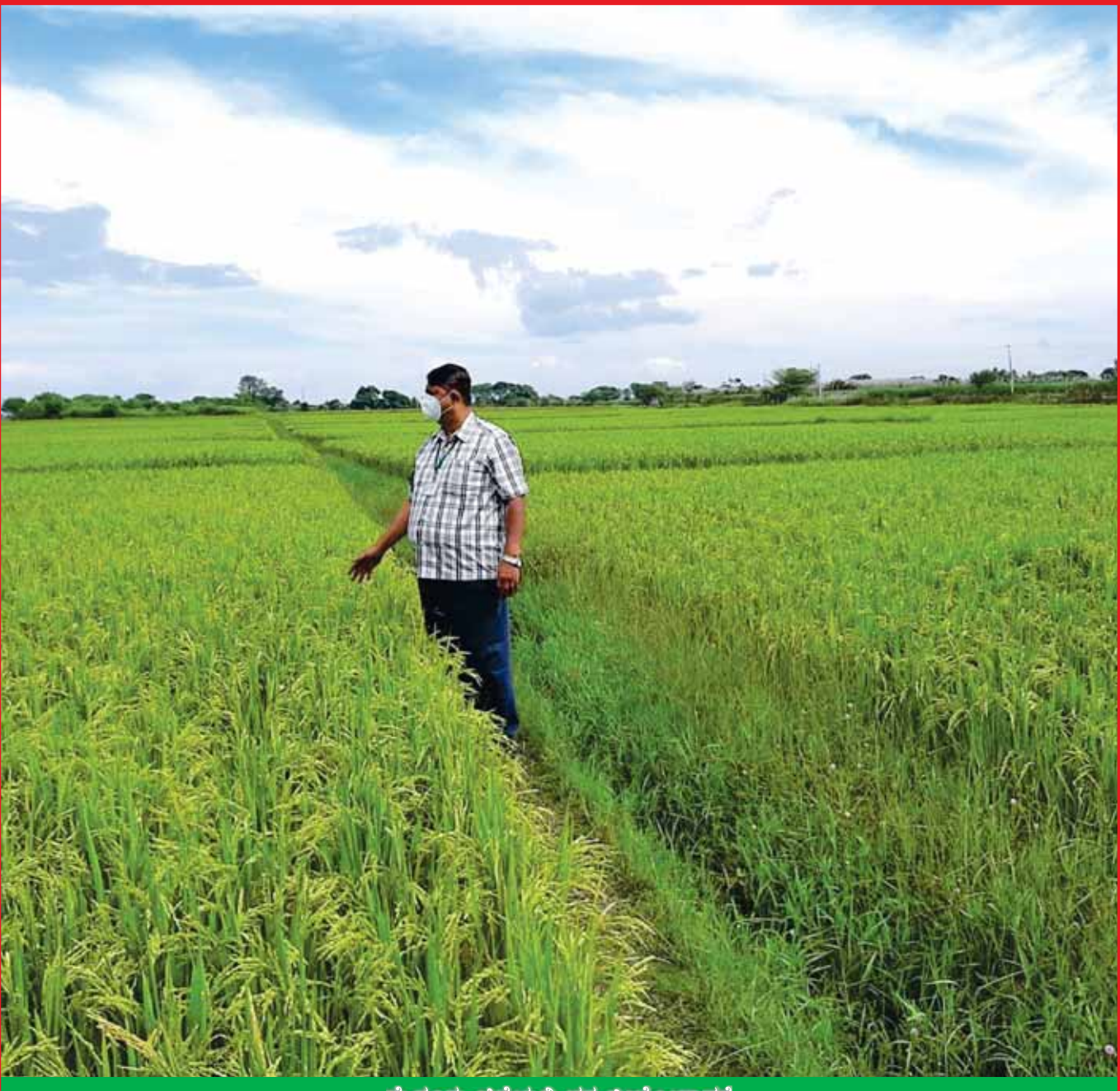
ಮೈಸೂರು ಜಿಲ್ಲೆಯಲ್ಲಿ ಭತ್ತ ಬೀಜೋತ್ಪಾದನೆ