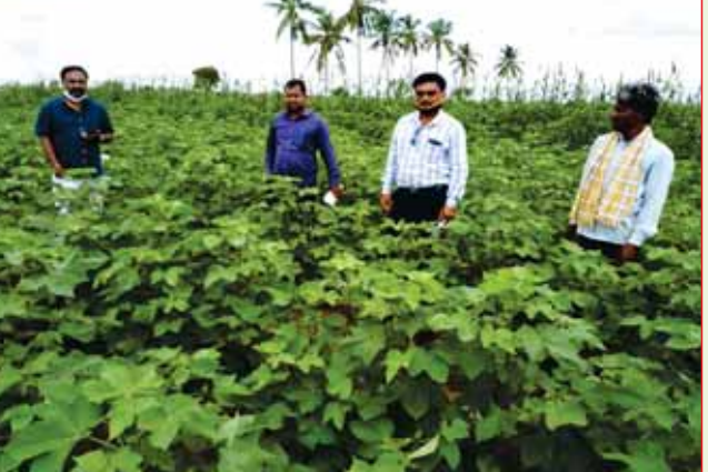
ಕೊಪ್ಪಳದಲ್ಲಿ ಹತ್ತಿ ಡಿ.ಸಿ.ಹೆಚ್.-32 ವಾಣಿಜ್ಯ ಬೀಜೋತ್ಪಾದನೆ