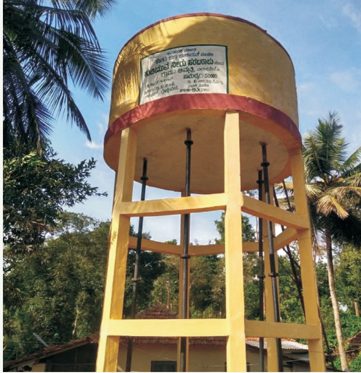
ವಿರಾಜಪೇಟೆ ತಾ. ಅಮ್ಮತ್ತಿ ಗ್ರಾಮ ಪಂಚಾಯತಿಯಲ್ಲಿ ಒವರ್ ಹೆಡ್ ಕುಡಿಯುವ ನೀರಿನ ಟ್ಯಾಂಕ್ ನಿರ್ಮಾಣ ಅಂದಾಜು ಮೊತ್ತ ರೂ. 16,00,000- /

GLSR in Majjigehall camp at Thithimathi GP in Virajpet Taluk Rs. 8.00 lakh