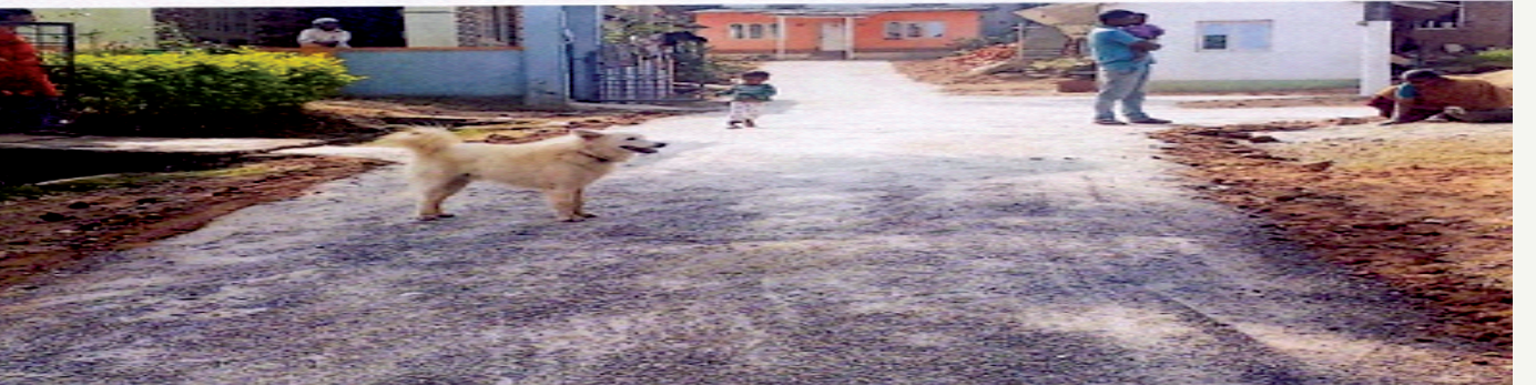
ಸೋಮವಾರಪೇಟೆ ತಾ|| ಹಂಡ್ಲಿ ಪಂ. ತಾಳೂರು ರಸ್ತೆ ಅಭಿವೃದ್ಧಿ. ಅಂದಾಜು ಮೊತ್ತ ರೂ : 2,65,000/- ಸಿಎಂಜಿಎಸ್‌ವೈ ಅನುದಾನ

Somwarpet taluk Handli Panchyath road development work Estimated cost Rs. 2,65,000/- CMGSY Grant