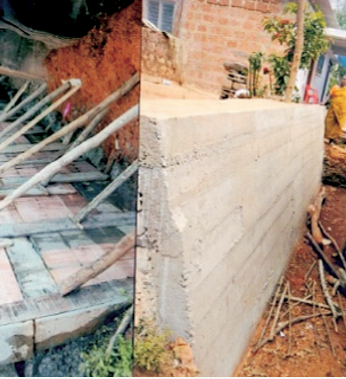
ಪೈಸಾರಿಗೆ ಸಾರ್ವಜನಿಕ ತಡೆಗೋಡೆ ನಿರ್ಮಾಣ 0, ಜಿಲ್ಲಾ ಪಂಚಾಯತಿ ಅನುದಾನ ikeri Taluk Nariyandada GP, Arapattu Paisari t : 2,00,000 ZP Grants