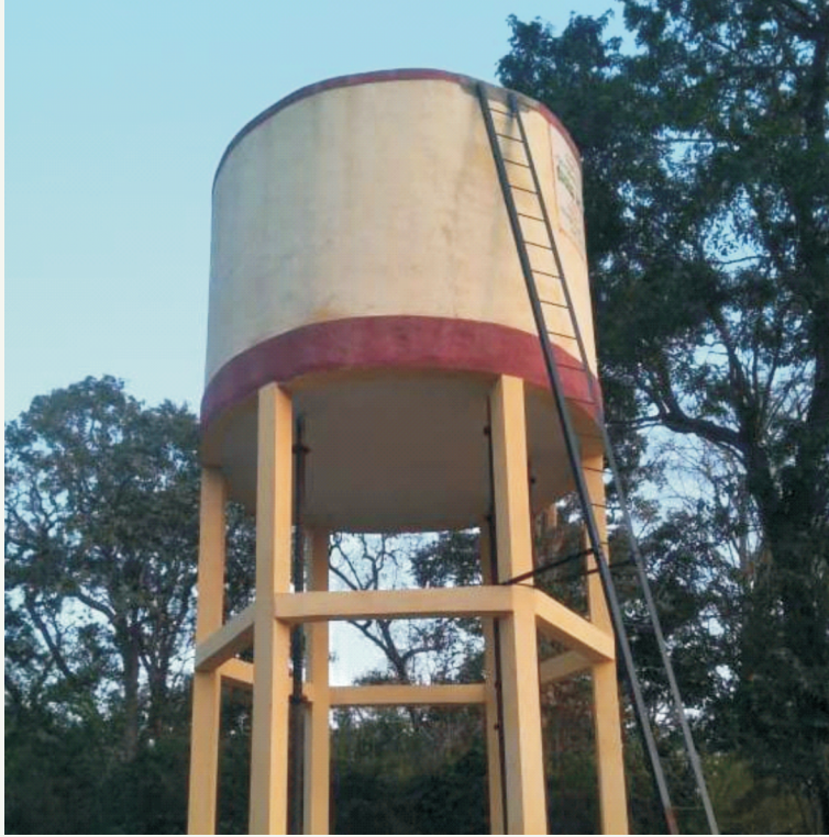
ವಿರಾಜಪೇಟೆ ತಾ. ನಿಟ್ಟೂರು ಗ್ರಾಮ ಪಂಚಾಯತಿಯ ತಟ್ಟೆಕೆರೆ ಒವರ್ ಹೆಡ್ ಕುಡಿಯುವ ನೀರಿನ ಟ್ಯಾಂಕ್ ನಿರ್ಮಾಣ ಅಂದಾಜು ಮೊತ್ತ ರೂ. 35,00,000-/-

OHT in Karekandi Thithimathi GP in Virajpet Taluk Rs. 20.00 lakhs