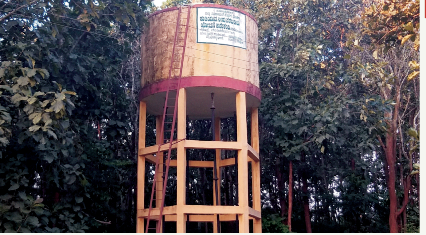
ವಿರಾಜಪೇಟೆ ತಾ. ತಿತಿಮತಿ ಗ್ರಾಮ ಪಂಚಾಯತಿಯ ಕಾರೆಕಂಡಿಯಲ್ಲಿ ಒವರ್ ಹೆಡ್ ಕುಡಿಯುವ ನೀರಿನ ಟ್ಯಾಂಕ್ ನಿರ್ಮಾಣ ಅಂದಾಜು ಮೊತ್ತ ರೂ. 20,00,000-/-

OHT in Karekandi Thithimathi GP in Virajpet Taluk Rs. 20.00 lakhs