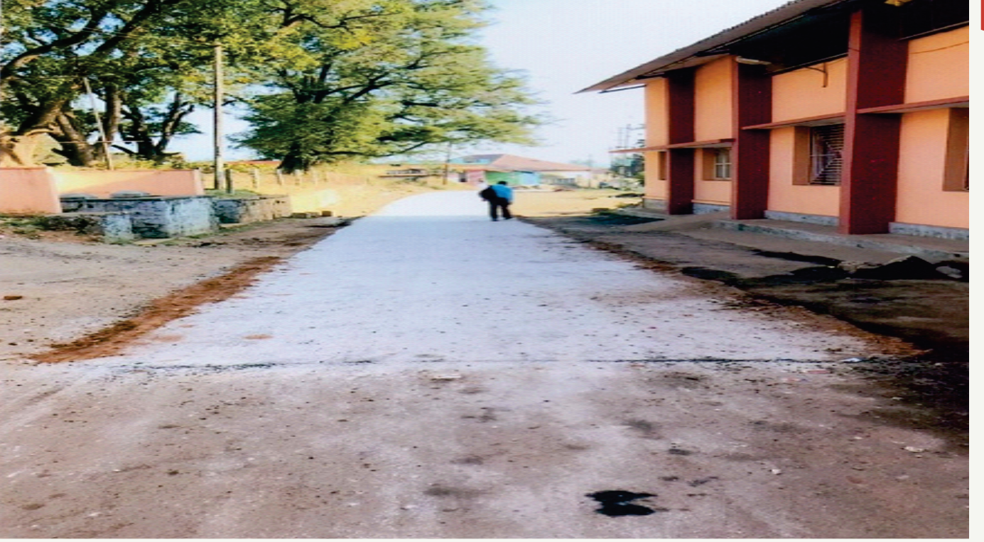
ಸೋಮವಾರಪೇಟೆ ತಾ|| ಶನಿವಾರಸಂತೆ ಗಣಪತಿ ದೇವಸ್ಥಾನದಿಂದ ಪೊಲೀಸ್ ಠಾಣಾ ರಸ್ತೆ ಅಭಿವೃದ್ಧಿ ಅಂದಾಜು ಮೊತ್ತ ರೂ. 2,68,000/- ಸಿಎಂಜಿಎಸ್‌ವೈ ಅನುದಾನ

Somwarpet taluk Shanivarasante Ganapathi temple to Police station road development work Estimated cost Rs. 2,68,000/- CMGSY Grant