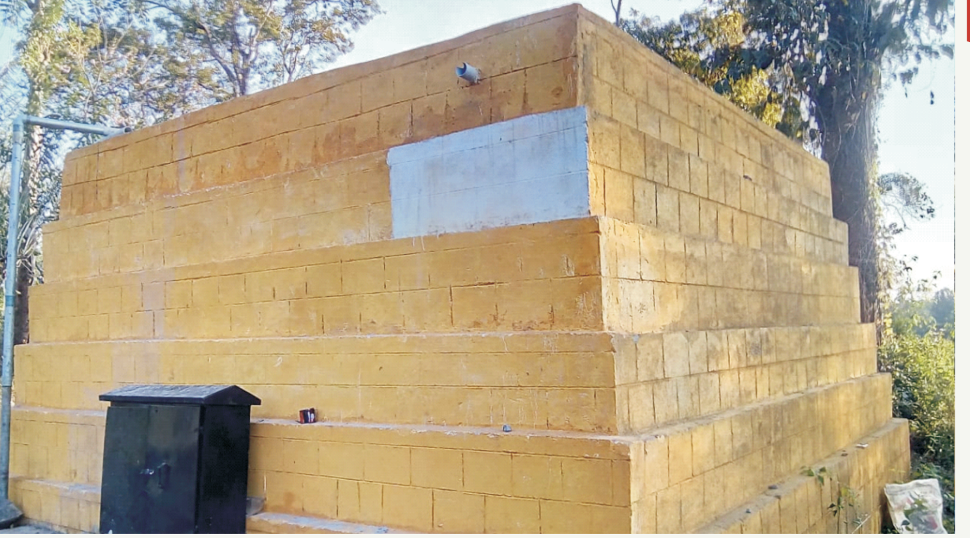
ವಿರಾಜಪೇಟೆ ತಾ. ತಿತಿಮತಿ ಗ್ರಾಮ ಪಂಚಾಯತಿಯ ಮಜ್ಜಿಗೆಹಳ್ಳಿಯಲ್ಲಿ ಕುಡಿಯುವ ನೀರಿನ ಟ್ಯಾಂಕ್ ನಿರ್ಮಾಣ ಅಂದಾಜು ಮೊತ್ತ ರೂ. 8,00,000- /

GLSR in Majjigehall camp at Thithimathi GP in Virajpet Taluk Rs. 8.00 lakh