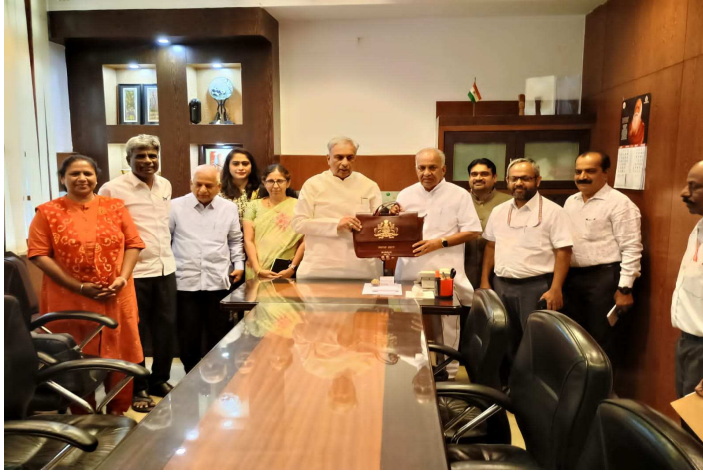
ಸನ್ಮಾನ್ಯ ಸಭಾಪತಿಯವರಿಗೆ ಗೌರವ ಸಮರ್ಪಣೆ