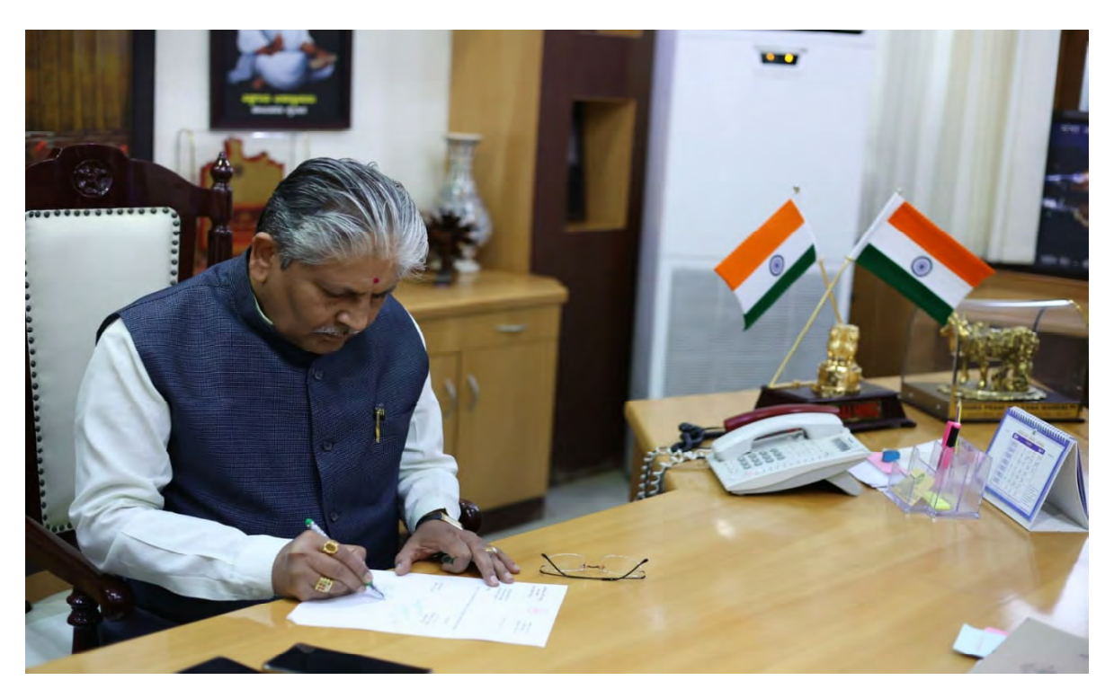
17.ಜೆಡಿಎಸ್ ತೊರೆದು ಬಿಜೆಪಿ ಸೇರ್ಪಡೆಯಾದ ಹೊರಟ್ಟ

ದಿನಾಂಕ 17.05.2022 ರಂದು ಕರ್ನಾಟಕ ವಿಧಾನ ಪರಿಷತ್ತಿನ ಸಭಾಪತಿಯಾಗಿ ಶ್ರೀ ರಘುನಾಥ್ರರಾವ ಮಲಕಾಪೂರೆ ರವರು ಅಧಿಕಾರ ಸ್ವೀಕರಿಸಿದರು ಈ ಸಂದರ್ಭ.