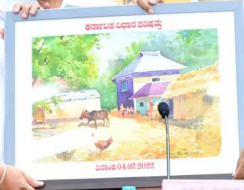
ಮಾನ್ಯ ಶಾಸಕರಿಗೆ ಕೊಡು ವಸ್ತು