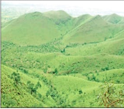
ಸಮಗ್ರ ಕರ್ನಾಟಕ ಸುದ್ದಿ

ಗದಗ: ಉತ್ತರ ಕರ್ನಾಟಕದ ಸಹ್ಯಾದ್ರಿ ಎಂದೇ ಕರೆಯಿಸಿಕೊಳ್ಳುವ ಕಪ್ಪತ್ತಗುಡ್ಡ ತನ್ನ ಒಡಲಲ್ಲಿ ಸಾವಿರಾರು ಔಷಧಿ ಗುಣವುಳ್ಳ ಸಸ್ಯ ಸಂಪತ್ತನ್ನು ಹೊಂದಿದ ನಾಡಿನ ಏಕೈಕ ಅಪರೂಪದ ತಾಣವಾಗಿದೆ. ಇದನ್ನು ಸಂರಕ್ಷಿಸಿಕೊಂಡು ಹೋಗುವ ದೊಡ್ಡ ಹೋಣೆಗಾರಿಕೆ, ಕಾಳಜಿ ನಮ್ಮೆಲ್ಲರ ಮೇಲಿದೆ ಎಂದು ಸಭಾಪತಿ ಬಸವರಾಜ ಹೊರಟ್ಟಿಯವರು ಅಭಿಪ್ರಾಯಪಟ್ಟಿದ್ದಾರೆ.