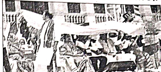
ಕಾರ್ಯಕ್ರಮದ ಮಧ್ಯೆ ಸುಂದರ ಮಳೆಯಿಂದ ಪ್ರೇಕ್ಷಕರು ಶ್ವಾಸೋಚ್ಚರಿಸುತ್ತಿದ್ದರು.

ನಾನು ಕೂಡ ಈ ಹಿಂದೆ ಕನ್ನಡ ಮತ್ತು ಸಂಸ್ಕೃತಿ ಇಲಾಖೆ ಮಂತ್ರಿ ಯಾಗಿ ಆ ನಂತರ ಮುಖ್ಯಮಂತ್ರಿ ಯಾದೆ. ನಾವೆಲ್ಲರೂ ದೊಡ್ಡಮಟ್ಟದ ಐತಿಹಾಸಿಕ ಕಾರ್ಯಕ್ರಮಕ್ಕೆ ಸಾಕ್ಷಿಯಾಗಿದ್ದೇವೆ. ಅದ್ವೈತ ಕಾರ್ಯಕ್ರಮವನ್ನು ಸರ್ಕಾರ ಅಚ್ಚುಕಟ್ಟಾಗಿ ನೆರವೇರಿಸಿದೆ. ಆ ಹಿನ್ನೆಲೆಯಲ್ಲಿ ಪ್ರಶಸ್ತಿ ಪುರಸ್ಕಾರ ಪರವಾಗಿ ನಾನು ಕನ್ನಡ ಮತ್ತು ಸಂಸ್ಕೃತಿ ಇಲಾಖೆ ಸಚಿವರು ಮತ್ತು ಸರ್ಕಾರಕ್ಕೆ ಅಭಿನಂದನೆ ಸಲ್ಲಿಸುತ್ತೇನೆ.