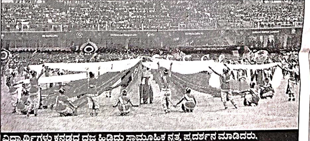
ವಿದ್ಯಾರ್ಥಿಗಳು ಕನ್ನಡದ ಧ್ವಜ ಹಿಡಿದು ಸಾಮೂಹಿಕ ನೃತ್ಯ ಪ್ರದರ್ಶನ ಮಾಡಿದರು.