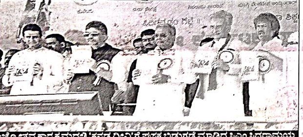
ರಾಜ್ಯೋತ್ಸವ ಕಾರ್ಯಕ್ರಮದಲ್ಲಿ 'ಕನ್ನಡ ಡಿಂಡಿಮ' ಭಕ್ತರ ಬಿಡುಗಡೆ ಮಾಡಿದ ಸಿಎಂ ಸಿದ್ದರಾಮಯ್ಯ

69ನೇ ಅದ್ವೈತ ಕನ್ನಡ ರಾಜ್ಯೋತ್ಸವ | ಮುಖ್ಯಮಂತ್ರಿ ಸಿದ್ದರಾಮಯ್ಯರಿಂದ ಕನ್ನಡ ಧ್ವಜಾರೋಹಣ ಸಾವಿರಾರು ವಿದ್ಯಾರ್ಥಿಗಳು ಭದ್ರ ವೇಷ ತೊಟ್ಟು ನೃತ್ಯ ಪ್ರದರ್ಶನ | ನಾಡಿನ ಕಲೆ, ಸಂಸ್ಕೃತಿ ಅನಾವರಣ