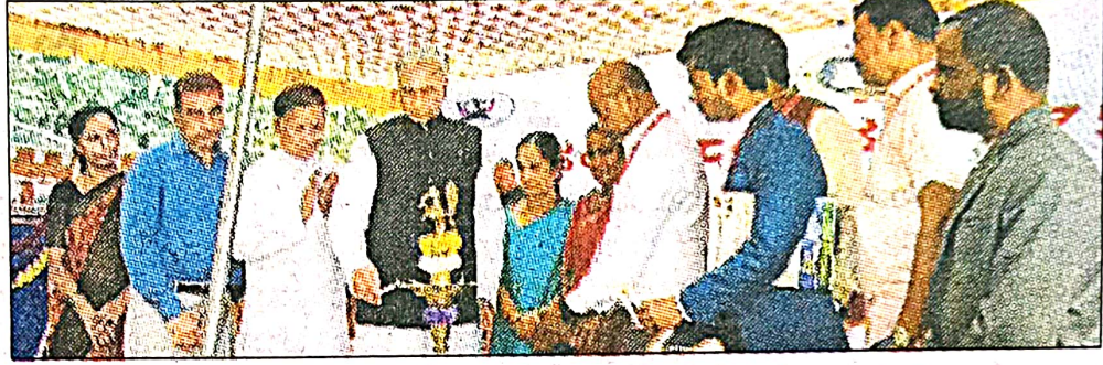
ಶಾಸಕರ ಭವನದಲ್ಲಿ ಆಯೋಜಿಸಿದ್ದ ಸಂವಿಧಾನಕ್ಕೆ 75ನೇ ವರ್ಷ-ಅಮೃತ ಮಹೋತ್ಸವವನ್ನು ವಿಧಾನ ಪರಿಷತ್ತಿನ ಸಭಾಪತಿ ಬಸವರಾಜ ಹೊರಟ್ಟಿ ಉದ್ಘಾಟಿಸಿದರು.

ಡಾ. ಬಿ.ಆರ್. ಅಂಬೇಡ್ಕರ್ ಭಾರತದಲ್ಲಿ ಹುಟ್ಟಿ ರದ್ದಿದ್ದರೆ, ನಮ್ಮ ಸಂವಿಧಾನದಲ್ಲಿರುವ ಪರಿಕಲ್ಪ ನೆಯೇ ಇರುತ್ತಿರಲಿಲ್ಲ. ಅವರು ನೀಡಿರುವ ಸಂವಿಧಾನ ಸ್ವಾತಂತ್ರ್ಯ ಭಾರತದ ಮೈಲಿಗಲ್ಲು. ಅವರನ್ನು ಒಂದು ಜಾತಿಗೆ ಸೀಮಿತಗೊಳಿಸಿ ನೋಡುವ ದೃಷ್ಟಿಕೋನ ಬದಲಾಗಬೇಕು ಎಂದು ಅವರು ಹೇಳಿದರು. ಕಾರ್ಯಕ್ರಮದಲ್ಲಿ ವಿಶ್ವಗುರು ಬುದ್ಧ ಪೊಡಕ್ಷನ್ಸ್ ಸಂಸ್ಥೆಯಿಂದ ನಿರ್ಮಿಸಿರುವ 'ಮನೆ ಮನಕ್ಕೆ ಸಂವಿಧಾನ' ಡಾಕ್ಯೂ ಡ್ರಾಮಾ ಸಾಕ್ಷ್ಯಚಿತ್ರ ವನ್ನು ಹೊರಟ್ಟಿ ಅವರು ಬಿಡುಗಡೆಗೊಳಿಸಿದರು. ಅಲ್ಲದೆ ವಿಶ್ವಗುರು ಬುದ್ಧ ಪೊಡಕ್ಷನ್ಸ್ ಪ್ರಸ್ತುತಿಯ