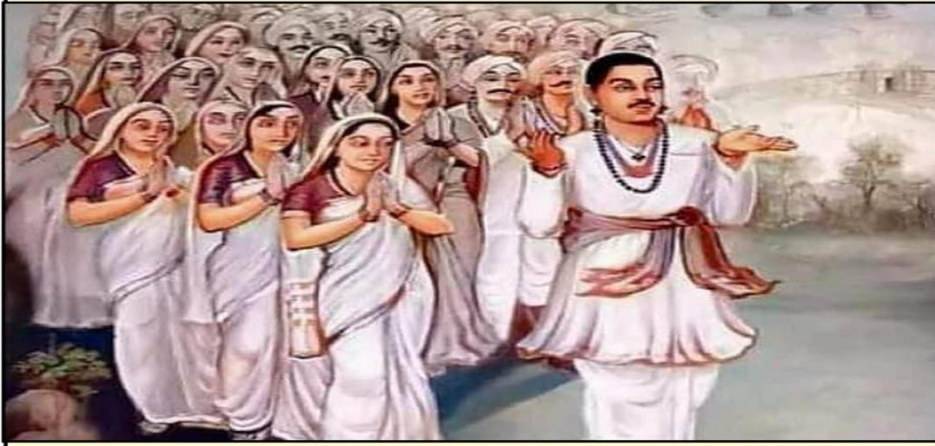
(ಮಹಾ ಮಾನವತಾವಾದಿ ಬಸವಣ್ಣನವರ ೮೯೧ನೇ ಜಯಂತಿ ಪ್ರಯುಕ್ತ ಲೇಖನ) ಕಲ್ಯಾಣವಾಣಿ