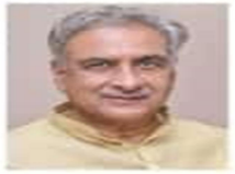
ಬಸವರಾಜ ಹೊರಟ್ಟಿ ಸಭಾಪತಿ, ಕರ್ನಾಟಕ ವಿಧಾನ ಪರಿಷತ್

ಸಾಕಾರಗೊಂಡಿವೆ. ಜಗತ್ತಿನ ಮೊಟ್ಟಮೊದಲ ಜನತಂತ್ರವಾದಿ ಎಂದರೆ ಬಸವಣ್ಣನವರು. ಹಾಗೆ ನೋಡಿದರೆ ಜನತಂತ್ರದ ವ್ಯಾಖ್ಯೆ ನೀಡಿದ ಮೊದಲ ವ್ಯಕ್ತಿಯೂ ಬಸವಣ್ಣನವರೇ. ಇಂತಹ ಶ್ರೇಷ್ಠ ವಿಚಾರಗಳನ್ನು ಇಡೀ ಜಗತ್ತು ಒಪ್ಪಿಕೊಂಡು ನಿತ್ಯ ಜೀವನದಲ್ಲಿ ಅಳವಡಿಸಿಕೊಂಡರೆ ಜಾಗತಿಕ ಸೌಹಾರ್ದತೆಯನ್ನು ಮೂಡಿಸಲು ಸಾಧ್ಯ. ಬಸವಣ್ಣನವರ 891ನೇ ಜಯಂತಿಯನ್ನು ಅಥರ್ವಪೂರ್ಣವಾಗಿ ಆಚರಿಸುವುದರ ಜೊತೆಗೆ ಅವರ ಆದರ್ಶಗಳನ್ನು ಪ್ರತಿಯೊಬ್ಬರೂ ಜೀವನದಲ್ಲಿ ಅಳವಡಿಸಿಕೊಳ್ಳುವ ಸಂಕಲ್ಪವನ್ನು ಮಾಡೋಣ ಅಂದಾಗ ಅದಕ್ಕೊಂದು ಮೌಲ್ಯ ಮಹತ್ವ ಬರುತ್ತದೆ. ಬಸವಣ್ಣನವರ ಜಯಂತಿ ಕೇವಲ ಆಚರಣೆಗಳಿಗೆ ಸೀಮಿತವಾಗದೇ ಬಸವ ಚಿಂತನೆಗಳನ್ನು ಪಾಲನೆ ಮಾಡುವತ್ತ ನಾವು ನೀವೆಲ್ಲ ಸಾಗೋಣ ಎಂದು ಸಭಾಪತಿ ಬಸವರಾಜ ಹೊರಟ್ಟಿಯವರು ನಾಡಿ ಜನತೆಗೆ ಕರೆ ನೀಡಿದ್ದಾರೆ.