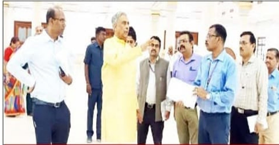
23 ಮುಖ್ಯಮಂತ್ರಿಗಳ ಭಾವಚಿತ್ರ ಅಳವಡಿಕೆ

23 ಮುಖ್ಯಮಂತ್ರಿಗಳ ಭಾವಚಿತ್ರಗಳ ಅಳವಡಿಸುವುದರಿಂದ ಮುಂದಿನ ಯುವ ಪೀಳಿಗೆಗೆ ರಾಜ್ಯದಲ್ಲಿ ಆಡಳಿತ ನಡೆಸಿದ ಮುಖ್ಯಮಂತ್ರಿಗಳ ಪರಿಚಯಿಸುವ ಉದ್ದೇಶದಿಂದ ಈ ಕಾರ್ಯ ಮಾಡಲಾಗುತ್ತಿದೆ. ಬಸವರಾಜ ಹೊರಟ್ಟಿಯವರು ಕೆಲ ದಿನಗಳ ಹಿಂದೆ ಈ ಬಗ್ಗೆ ಮುಖ್ಯಮಂತ್ರಿಗಳಿಗೆ ಪತ್ರ ಬರೆದು 1947ರಿಂದ ಇಂದಿನವರೆಗೆ ರಾಜ್ಯವನ್ನು ಸಮರ್ಥವಾಗಿ ಮುನ್ನಡೆಸಿರುವ ಎಲ್ಲಾ ಮುಖ್ಯಮಂತ್ರಿಗಳ ಭಾವಚಿತ್ರವನ್ನು