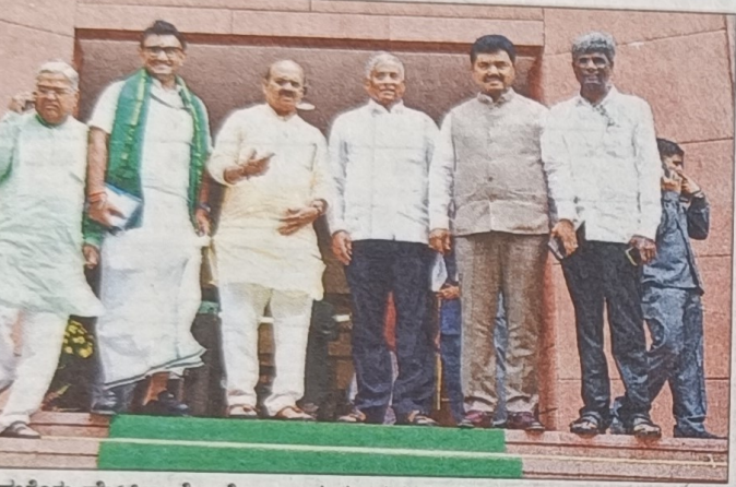
ಲೋಕಸಭೆಯ ಮೆಟ್ಟಿಲ ಮೇಲೆ ರಾಜ್ಯದ ನೂತನ ಸಂಸದರು.

ಲೋಕಸಭೆ, ವಿಧಾನ ಪರಿಷತ್ ಸೇರಿ 45 ಜನಪ್ರತಿನಿಧಿಗಳಿಂದ ಪ್ರತಿಜ್ಞೆ ಸ್ವೀಕಾರ | ಪ್ರಮಾಣ ವಚನ ದಿನವಾದ ಸೋಮವಾರ