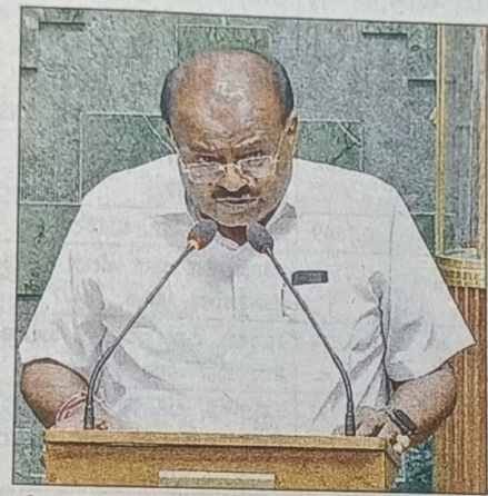
ಮೊದಲಿಗಾಗಿ ಎಚ್ಚಿಕೆ ಪ್ರಮಾಣ ಸ್ವೀಕಾರ.