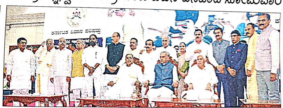
ವಿಧಾನ ಪರಿಷತ್‌ನಲ್ಲಿ ಸೋಮವಾರ ಪ್ರಮಾಣ ವಚನ ಸ್ವೀಕರಿಸಿದ ನೂತನ ಎಂಎಲ್‌ಸಿಗಳ ಜತೆ ಸಿಎಂ ಸಿದ್ದರಾಮಯ್ಯ, ಸ್ಥಳೀಯ ಮಂತ್ರಿಗಳು.