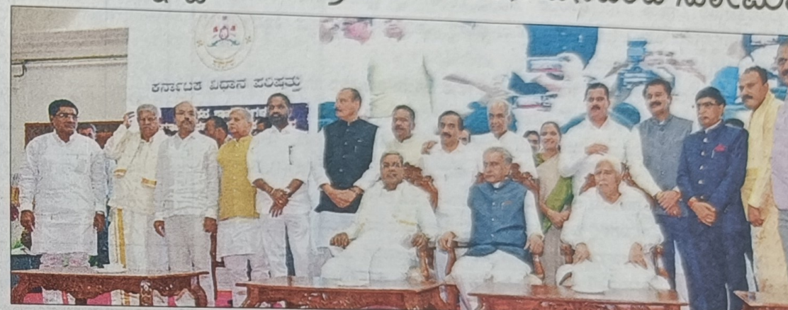
ವಿಧಾನ ಪರಿಷತ್‌ನಲ್ಲಿ ಸೋಮವಾರ ಪ್ರಮಾಣ ವಚನ ಸ್ವೀಕರಿಸಿದ ನೂತನ ಎಂಎಲ್‌ಸಿಗಳ ಜತೆ ಸಿಎಂ ಸಿದ್ದರಾಮಯ್ಯ, ಸಭಾಪತಿ ಹೊರಟ್ಟು