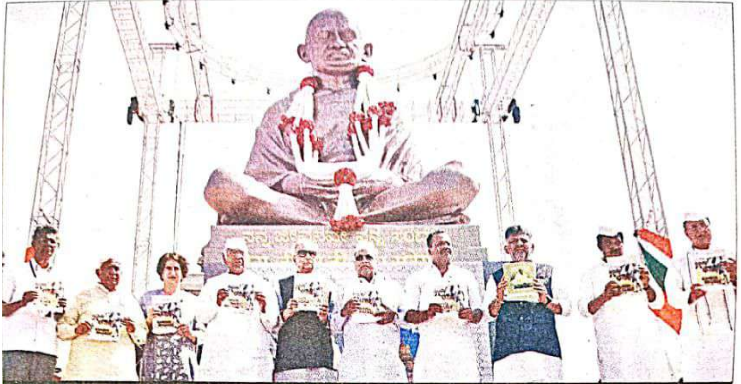
ಬೆಳಗಾವಿಯ ಸುವರ್ಣ ವಿಧಾನಸೌಧದ ಮುಂಭಾಗದಲ್ಲಿ ಮಂಗಳವಾರ ಅನಾವರಣಗೊಳಿಸಲಾದ ಮಹಾತ್ಮ ಗಾಂಧಿ ಪ್ರತಿಮೆಯ ಮುಂದೆ ಕಾಂಗ್ರೆಸ್ ನಾಯಕರು.