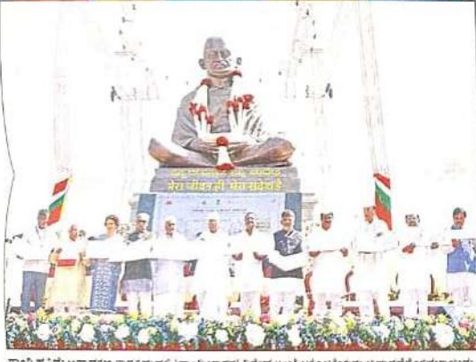
ಗಾಂಧಿ ಪ್ರತಿಮೆ ಅನಾವರಣ ಕಾರ್ಯಕ್ರಮದಲ್ಲಿ 'ಗಾಂಧಿ ಫೌಂಡ್' ವಿಶೇಷ ಅಂಚೆ ಲೇಟೋಟಿಯನ್ನು ಬಿಡುಗಡೆಗೊಳಿಸಲಾಯಿತು.

ಬೆಂಗಳೂರಿನಲ್ಲಿ ಪ್ರತಿಮೆಯನ್ನು ಮಂಗಳವಾರ ಎಂಟು ಅಡ್ಡಕ್ಕೆ ಡಾಬ್ಬಿಸಿ ಪ್ರತಿಷ್ಠೆ ನಾಯಕ ಮಲ್ಲಿಕಾರ್ಜುನ ಖರ್ಗೆ ಅವರ ಅಧ್ಯಕ್ಷತೆಯಲ್ಲಿ 1924ರಲ್ಲಿ ಬೆಳಗಾವಿಯಲ್ಲಿ ಜರುಗಿದ ಕಾಂಗ್ರೆಸ್ ಅಧಿವೇಶನದ ಚರ್ಚನೋತ್ಸವದ ಸಂದರ್ಭದಲ್ಲಿ ಸುಮಾರು ಎಂಟು-ನಾಲ್ಕು ಅಂತಸ್ತು ಪ್ರತಿಮೆಯನ್ನು ಸ್ಥಾಪಿಸಲಾಗಿದೆ. ಕಲಬುರಗಿಯಲ್ಲೂ ಗಾಂಧಿ ಪ್ರತಿಮೆ: ಈ ವೇಳೆ ಮಾತನಾಡಿದ ಖರ್ಗೆ ಅವರು, "ಗಾಂಧೀಜಿ 1924ರ ಅಧಿವೇಶನದಲ್ಲಿ ಅಷ್ಟ ಸ್ಥಳ ನಿವಾಸಿಗಳಿಗೆ ಕೆರೆ ನೀಡಿದ್ದರು. ಅದರೊಂದಿಗೆ ಬೆಳಗಾವಿಯ ಈ ನೆಲ ಐತಿಹಾಸಿಕ ಮಾಹಿತಿ ಹೊಂದಿದೆ. ಗಾಂಧೀಜಿ ಅಧ್ಯಕ್ಷತೆಯ ಚರ್ಚನೋತ್ಸವ ಸಂಭ್ರಮದಲ್ಲಿ ನಾನು ಕಾಂಗ್ರೆಸ್ ಅಧ್ಯಕ್ಷನಾಗಿರುವುದು ಫೈನ್ ಎಂದು ಭಾವಿಸುತ್ತೇನೆ. ಮುಂದಿನ ದಿನಗಳಲ್ಲಿ ಕೆಲಸವಾಗುವುದಿಲ್ಲವೆಂದು ಭಾವಿಸಿ ಮುಕ್ತಗಾಂಧಿ ನೆಲೆಯಲ್ಲಿರುವ ಪ್ರತಿಮೆ ಗಾಂಧಿ ಪ್ರತಿಮೆ ನಿರ್ಮಾಣ