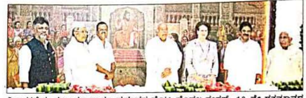
ವಿಧಾನಸಭೆಯ ಸಭಾಂಗಣ ಹಾಗೂ ಪ್ರಪಂಚದ ಮೊಟ್ಟ ಮೊದಲ ಸಂಸತ್, 12 ನೇ ಶತಮಾನದ ಅನುಭವ ಮಂಟಪದ ಕೈಲವರ್ಣ ಚಿತ್ರವನ್ನು ವೀಕ್ಷಿಸಿದ ಕಾಂಗ್ರೆಸ್ ಮುಖಂಡರು.