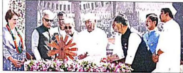
ಸುವರ್ಣ ಸೌಧದ ಎದುರು ಮಹಾತ್ಮ ಗಾಂಧೀಜಿ ಪ್ರತಿಮೆಯನ್ನು ಚರಕ ತಿರುಗಿಸುವ ಎಪಿಸಿ ಅಧ್ಯಕ್ಷ ಮಲ್ಲಿಕಾರ್ಜುನ ಖರ್ಚು ಅನಾವರಣಗೊಳಿಸಿದರು. ಪ್ರಿಯಾಂಕಾ ವಾದ್ರಾ, ಸಿಎಂ, ಡಿಸಿಎಂ ಇದ್ದರು.

ವಿಷಯೀಯ ಬಿತ್ತಲು ಅವಕಾಶ ನೀಡುವು: ಮುಖ್ಯಮಂತ್ರಿ ಸಿದ್ದರಾಮಯ್ಯ ಅವರು ಮಾತನಾಡಿ, ಮಹಾತ್ಮ ಗಾಂಧಿಜಿ ಹಿಂದೂ ವಿರೋಧಿ ಆಗಿರಲಿಲ್ಲ, ಸಾವಿನ ಕೊನೆಗೊಂಡಿದ್ದರೇ ರಾಮ್ ಎಂದು ಹೇಳಿದ್ದರು. ಎಲ್ಲ ಧರ್ಮಗಳನ್ನು ಸಮಾನವಾಗಿ ಕಾಣುವ ಹೃದಯ ವೈಶಾಲ್ಯವನ್ನು ಅವರು ಹೊಂದಿ ದ್ದರು. ಆದರೆ ಬೆಚ್ಚಿಮೆಯವರು ಧರ್ಮಗಳ ನಡುವೆ ವಿಷಯೀಯ ಹತ್ತುವ