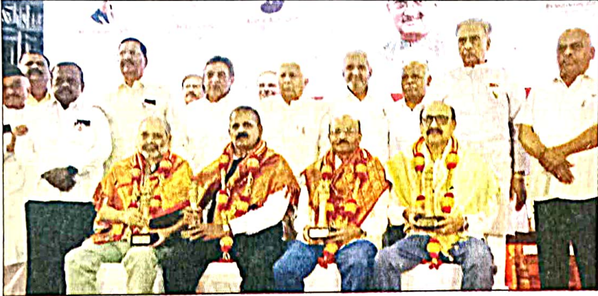
ವಿಧಾನಸೌಧದ ಬ್ಯಾಂಕ್ ಟ್ ಹಾಲ್‌ನಲ್ಲಿ ಮಂಗಳವಾರ ಆಯೋಜಿಸಿದ್ದ ಬಿ. ಬಸವಲಿಂಗಪ್ಪ ಜನ್ಮ ಶತಮಾನೋತ್ಸವ ಕಾರ್ಯಕ್ರಮದಲ್ಲಿ ವಿವಿಧ ಕ್ಷೇತ್ರಗಳ ಸಾಧಕರನ್ನು ಸನ್ಮಾನಿಸಲಾಯಿತು.

■ ಉದಯವಾಣಿ ಸಮಾಚಾರ ಬೆಂಗಳೂರು: ರಾಜಕೀಯರಂಗ ಪ್ರವೇಶಿಸುವ ಹೊಸಬರಿಗೆ ಸೂಕ್ತ ತರಬೇತಿ ನೀಡುವ ಉದ್ದೇಶದಿಂದ ಮುಂಬರುವ ದಿನಗಳಲ್ಲಿ ರಾಜ್ಯದಲ್ಲಿ ರಾಜಕೀಯ ಕಾಲೇಜು ಆರಂಭಿಸುವ ಚಿಂತನೆ ಇದೆ ಎಂದು ವಿಧಾನ ಪರಿಷತ್ತಿನ ಸಭಾಪತಿ ಬಸವರಾಜ ಹೊರಟ್ಟಿ ತಿಳಿಸಿದರು. ವಿಧಾನಸೌಧದ ಬ್ಯಾಂಕ್ ಟ್ ಹಾಲ್‌ನಲ್ಲಿ ಮಂಗಳವಾರ ಬಸವಲಿಂಗಪ್ಪ ಜನ್ಮ ಶತಮಾನೋತ್ಸವ ಆಚರಣಾ ಸಮಿತಿ, ಬಸವಲಿಂಗಪ್ಪ ಅಭಿವೃದ್ಧಿ ಅಧ್ಯಯನ ಸಂಸ್ಥೆ ಆಯೋಜಿಸಿದ್ದ ಬಿ. ಬಸವಲಿಂಗಪ್ಪ ಜನ್ಮ ಶತಮಾನೋತ್ಸವ ಕಾರ್ಯಕ್ರಮದಲ್ಲಿ ಅವರು ಮಾತನಾಡಿದರು. ಬಿ. ಬಸವಲಿಂಗಪ್ಪ ಮಾದರಿಯಲ್ಲಿ ಜನಪ್ರತಿನಿಧಿಗಳನ್ನು ಸಿದ್ಧಪಡಿಸುವ ಅಗತ್ಯವಿದೆ. ಈ ಉದ್ದೇಶದೊಂದಿಗೆ ರಾಜಕೀಯ ಕಾಲೇಜು ಆರಂಭಿಸುವ ಚಿಂತನೆಯಿದೆ. ಅಲ್ಲಿ ಹೊಸಬರಿಗೆ ಸೂಕ್ತ ಮಾರ್ಗದರ್ಶನ ಮತ್ತು ತರಬೇತಿ ನೀಡಿ ಜನರ ಕಷ್ಟಗಳಿಗೆ ಸ್ಪಂದಿಸುವ, ಸಮಾಜದ ಅಭಿವೃದ್ಧಿಗೆ ಶ್ರಮಿಸುವ ಜನಪ್ರತಿನಿಧಿಗಳನ್ನು ರೂಪಿಸಲಾಗುವುದು ಎಂದು ತಿಳಿಸಿದರು. ಈಗ ಶಾಸನ ಸಭೆಗೆ ಬರುವ ಜನಪ್ರತಿನಿಧಿಗಳಿಗೆ ಬಸವಲಿಂಗಪ್ಪ ಅವರ ವ್ಯಕ್ತಿತ್ವ, ಹೋರಾಟ ಹಾದಿಯೇ ತಿಳಿದಿಲ್ಲ. ಅನೇಕರನ್ನು ಬಸವಲಿಂಗಪ್ಪ ಅವರ ಬಗ್ಗೆ ಪ್ರಶ್ನಿಸಿದರೆ ಮಾಹಿತಿಯೇ ಇಲ್ಲ ಎಂದು ಹೇಳುತ್ತಾರೆ. ಅಂತಹವರಿಗೆಲ್ಲ ಮೊದಲು ಗ್ರಂಥಾಲಯಗಳಿಗೆ ತರಳ ಬಸವಲಿಂಗಪ್ಪ ಅವರ ಬಗ್ಗೆ ತಿಳಿದುಕೊಳ್ಳುವಂತೆ ಹೇಳುತ್ತೇನೆ. ಬಸವಲಿಂಗಪ್ಪ ಅವರು ತಳ ಸಮುದಾಯದ