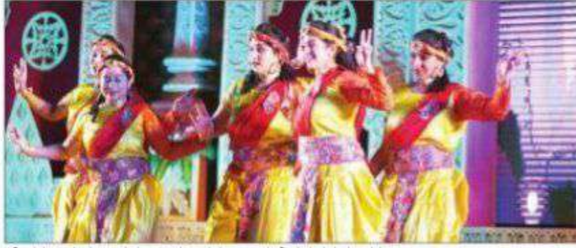
ಬೆಂಗಳೂರಿನ ಪ್ರಭಾತ್ ಕಲಾವಿದರಿಂದ ಕರ್ನಾಟಕ ವೈಭವ ನೃತ್ಯ ರೂಪಕ.

ರಾಷ್ಟ್ರಕೆ ಮೈಸೂರು ಮಾದರಿ: ಈ ವೇಳೆ ವಿಧಾನಸಭೆ ಸ್ಪೀಕರ್ ವಿಶ್ವೇಶ್ವರ ಹೆಗಡೆ ಕಾಗೇರಿ ಮಾತನಾಡಿ, ಸಾಂಸ್ಕೃತಿಕ, ಧಾರ್ಮಿಕ, ಶೈಕ್ಷಣಿಕವಾಗಿ ರಾಷ್ಟ್ರಕೆ ಮೈಸೂರು ಮಾದರಿಯಾಗಿದೆ. ಮುಮ್ಮಡಿ ಕೃಷ್ಣರಾಜರಿಂದ ಆರಂಭವಾದ ದಸರಾ ವೈಭವವು 4 ಶತಮಾನಗಳಿಂದ ಅದರ ಪರಂಪರೆ ಮುಂದುವರೆದು ಬಂದಿದೆ. ನಾಲ್ಕಡಿಯವರು ಮೈಸೂರು ಮಹಾರಾಜರಾಗಿ