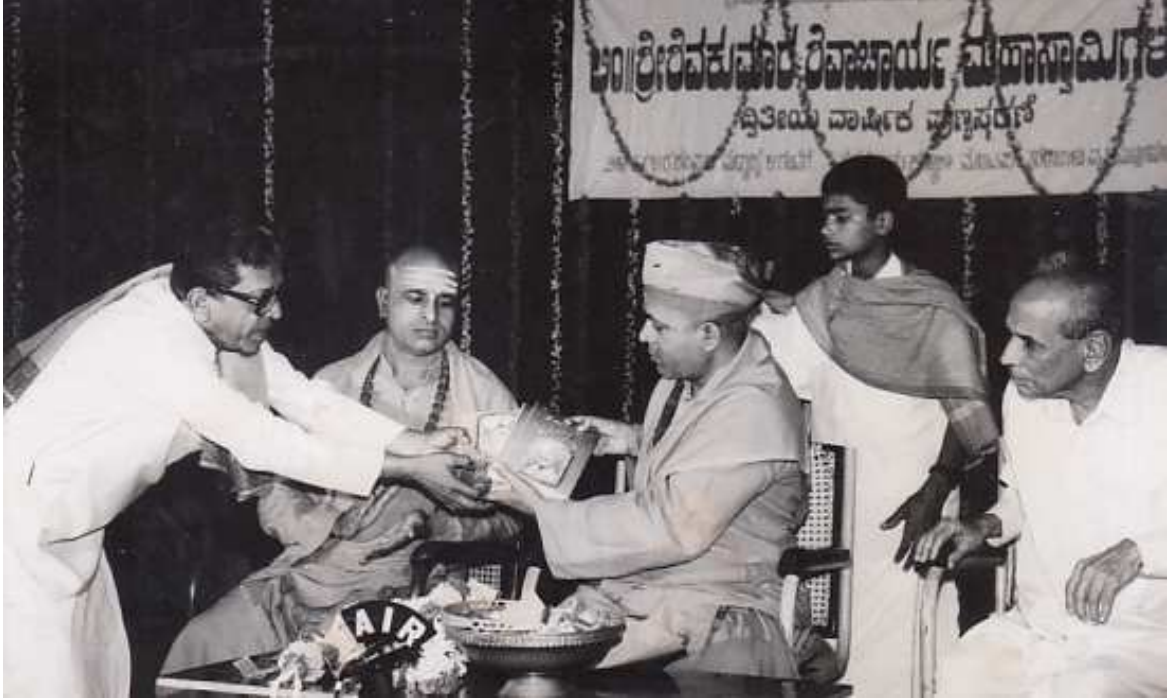
ಸಿರಿಗೆರೆ ಬೃಹಸ್ಪತದ ಹಿರಿಯ ಜಗದ್ಗುರು ಡಾ|| ಶಿವಮೂರ್ತಿ ಶಿವಾಚಾರ್ಯ ಸ್ವಾಮಿಗಳು ಹಾಗೂ ಸಾಣೇಹಳ್ಳಿ ಶಾಖಾಮಠದ ಪಂಡಿತಾರಾಧ್ಯ ಸ್ವಾಮಿಗಳೊಂದಿಗೆ