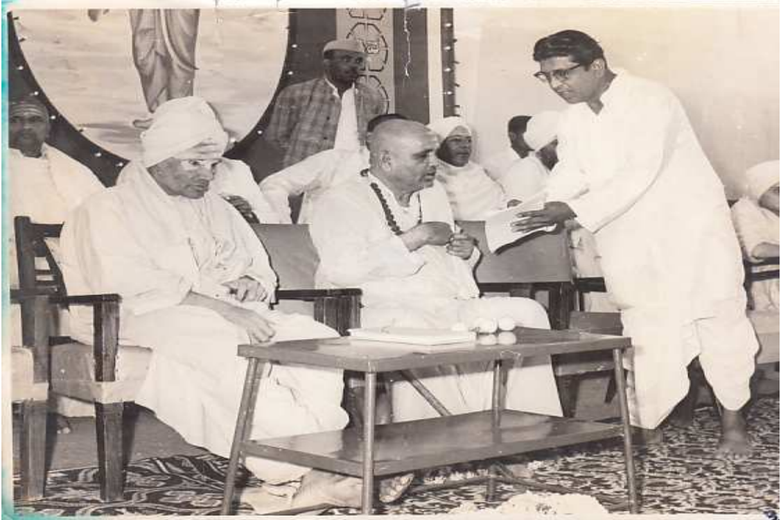
ಸಿದ್ದಗಂಗಾ ಮಠದ ಜಗದ್ಗುರು ಶಿವಕುಮಾರ ಸ್ವಾಮಿಗಳು ಹಾಗೂ ಲಿಂಗೈಕ್ಯ ಜಗದ್ಗುರು ಶಿವಕುಮಾರ ಸ್ವಾಮಿಗಳೊಂದಿಗೆ