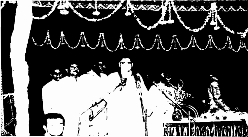
ಚುನಾವಣಾ ಪ್ರಚಾರದಲ್ಲಿ ರಾಜೀವ್ ಗಾಂಧಿಯವರೊಂದಿಗೆ