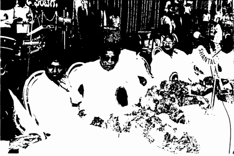
ಕಾರ್ಯಕ್ರಮವೊಂದರಲ್ಲಿ ಶ್ರೀ ಮಲ್ಲಿಕಾರ್ಜುನ ಖರ್ಗೆ ಹಾಗೂ ಡಾ. ಸಿದ್ದಲಿಂಗಯ್ಯನವರೊಂದಿಗೆ