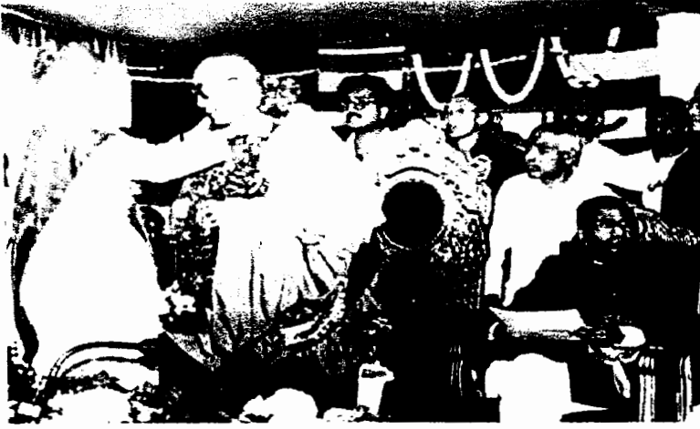
ವೀರೇಂದ್ರಪಾಟೀಲ್ ಉಪಸ್ಥಿತಿಯಲ್ಲಿ ಬೌದ್ಧ ಧರ್ಮ ಗುರು ದಲೈ ಲಾಮಾ ಅವರನ್ನು ಸನ್ಮಾನಿಸುತ್ತಿರುವುದು