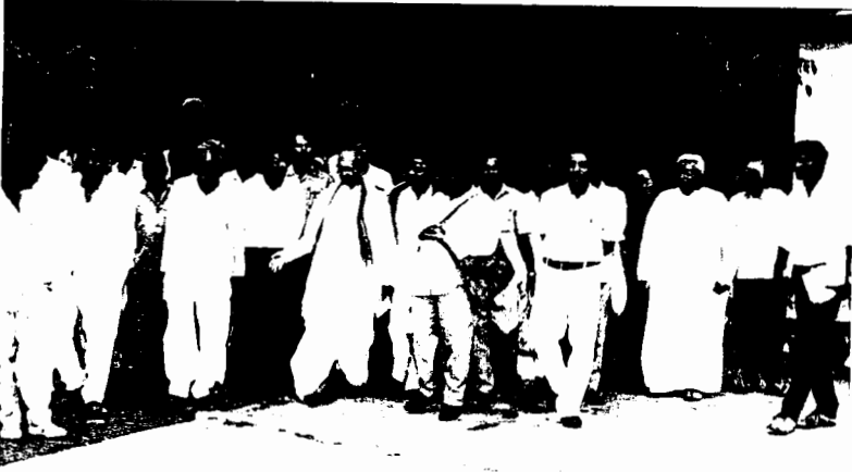
ತೋಷಿತ ಸಮುದಾಯದೊಟ್ಟಿಗೆ ಬಿ. ಬಸವಲಿಂಗಪ್ಪ