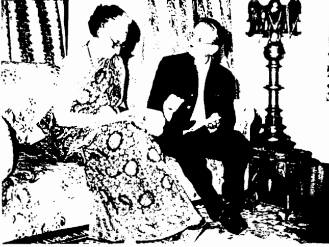
ರಾಜ್ಯದ ಅಭಿವೃದ್ಧಿ ಯೋಜನೆಗಳನ್ನು ಚರ್ಚಿಸುತ್ತಿರುವುದು