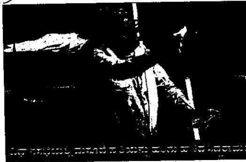
ವಿಧಾನಸಭೆಯಲ್ಲಿ ಮಸೂದೆ ಪರಿಧಿ ಡಿಕೆಶಿ ಮತ್ತು ಎಪಿಎಂಸಿ ತಿದ್ದುಪಡಿ ಮಸೂದೆ ಹಾಗೂ ಡಿ.ಕೆ.ಶಿವಕುಮಾರ್.

ವಿಧೇಯಕ ಕುರಿತು ಶನಿವಾರ ಸುದೀರ್ಘ ಚರ್ಚೆಯ ಬಳಿಕ ಕಂದಾಯ ಸಚಿವ ಆರ್. ಅಶೋಕ್ ಅವರು ವಿಧೇಯಕವನ್ನು ಪರ್ಯಾಲೋಚಿಸಿ ಅಂಗೀಕರಿಸಬೇಕು ಎಂದು ಕೋರಿದರು. ಪ್ರತಿಪಕ್ಷ ಕಾಂಗ್ರೆಸ್ ವಿಧೇಯಕ ಜಾರಿಗೆ ತೀವ್ರ ವಿರೋಧ ವ್ಯಕ್ತಪಡಿಸಿತು. ಒಂದು ಹಂತದಲ್ಲಿ ಪ್ರತಿಪಕ್ಷ ನಾಯಕ ಸಿದ್ದರಾಮಯ್ಯ ಅವರು ಅವೇಶಭಂಗಿರಾಗಿ ವಿಧೇಯಕವನ್ನು ಹರಿದು ಹಾಕಿ ಬಿಡಿದರು. 10