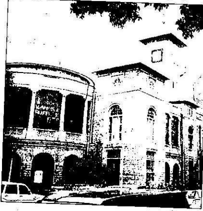
ಚುನಾವಣಾ ಆಯೋಗದ ವಾದ

“ಪಾಲಿಕೆಯ ಅಧಿಕಾರವಧಿ ಮುಗಿದ ಬಳಿಕ ವಾರ್ಡ್ ಮರು ವಿಂಗಡಣೆ ಕಾಯಿದೆ ಜಾರಿಗೊಳಿಸಲಾಗಿದೆ, ಹಾಗಾಗಿ, ಚುನಾವಣೆ ನಡೆಸಲಾಗುತ್ತಿಲ್ಲ