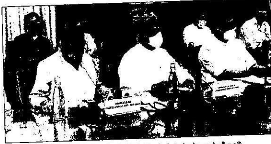
ಸುದ್ದಿಗೋಷ್ಠಿಯಲ್ಲಿ ಮಾಹಿತಿ ನೀಡಿದ ಸಚಿವ ಪ್ರಲ್ಹಾದ ಜೋಶಿ.

ಜನವರಿ 29ರಂದು ಆರಂಭವಾದ ಬಜೆಟ್ ಅಧಿವೇಶನದಲ್ಲಿ ಒಟ್ಟು 20 ಮಸೂದೆಗಳು ಮಂಡಿಸಲ್ಪಟ್ಟಿವೆ. ಈ ಪೈಕಿ ಲೋಕಸಭೆಯಲ್ಲಿ 17 ಮತ್ತು ರಾಜ್ಯಸಭೆಯಲ್ಲಿ 3 ಮಸೂದೆಗಳು ಮಂಡನೆಯಾಗಿವೆ. ಇದರಲ್ಲಿ 18 ಲೋಕಸಭೆಯಲ್ಲಿ, 19 ರಾಜ್ಯಸಭೆಯಲ್ಲಿ ಅಂಗೀಕಾರವಾಗಿದೆ. ಉಭಯ ಸದನಗಳಲ್ಲಿ ಅಂಗೀಕರಿಸಲ್ಪಟ್ಟ ಮಸೂದೆಗಳ ಸಂಖ್ಯೆ 18 ಎಂದು ಜೋಶಿ ಹೇಳಿದರು.