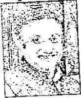
» ಕೋರ್ಟ್‌ನತ್ತ ಪ್ರತಿಪಕ್ಷ ಚಿತ್ರ