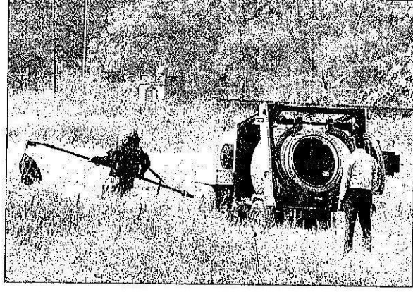
ಬಾಂಬ್ ಇದ್ದ ಬ್ಯಾಗ್ ಅನ್ನು ಕೆಂಜಾರು ಮೈದಾನದಲ್ಲಿ ನಾಶಪಡಿಸಲು ಕೊಂಡೊಯ್ಯುತ್ತಿರುವ ಬಾಂಬ್ ಪತ್ತೆ ಮತ್ತು ನಿಷ್ಕಿಯ ದಳದ ಸಿಬ್ಬಂದಿ (ಎಡಚಿತ್ರ) ಸ್ಪೋಟದ ಬಳಿಕದ ದೃಶ್ಯ

ಬ್ಯಾಗ್ ಒಳಗಿತ್ತು ಬಾಂಬ್: 'ಬ್ಯಾಗ್ ಫ್ಯಾಕ್ಟ್' ಮಾದರಿಯ ಬ್ಯಾಗ್‌ವೊಂದು ವಿಮಾನ ನಿಲ್ದಾಣದ ಪ್ರವೇಶದ್ವಾರದ ಬಳಿ ಕುರ್ಚಿಯ ಮೇಲೆ ಶಂಕಾಸ್ಪದ ರೀತಿಯಲ್ಲಿ ಇರುವುದನ್ನು ಅಲ್ಲಿನ