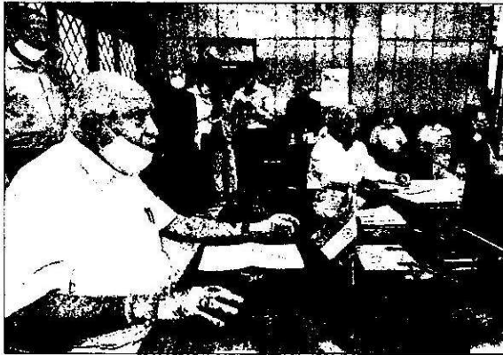
ಸಚಿವರು, ಅಧಿಕಾರಿಗಳ ಜತೆ ಸಭೆ ನಡೆಸಿದ ಸಿಎಂ ಬಿ.ಎಸ್. ಯಡಿಯೂರಪ್ಪ

ರಾಜ್ಯದಲ್ಲಿ ಕೊರೊನಾ ನಿಯಂತ್ರಣಕ್ಕೆ ಕಠಿಣ ಕ್ರಮ: ಸಿಎಂ