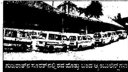
ಗುಜರಾತ್‌ನ ಸೂರತ್‌ನಲ್ಲಿ ಶವ ಹೊತ್ತು ಬಂದ ಆಂಬುಲೆನ್ಸ್‌ಗಳು

ಬೆಂಗಳೂರಲ್ಲೂ ಅಂತ್ಯಕ್ರಿಯೆ ನಡೆಸಲು ಸಂಬಂಧಿಕರ ಕ್ಷೋ