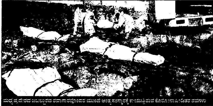
ಮಧ್ಯಪ್ರದೇಶದ ಜಬಲ್ಪುರದ ಚಿತಾಗಾರವೊಂದರ ಮುಂದೆ ಅಂತ್ಯಸಂಸ್ಕಾರಕ್ಕೆ ಕಾಯುತ್ತಿರುವ ಕೊರೋನಾ ಸೋಂಕಿತರ ಶವಗಳು

ಗುಜರಾತ್‌ನ ಸೂರತ್ ಚಿತಾಗಾರವೊಂದಕ್ಕೆ ಇತ್ತ 80-100 ಶವ ತರಲಾಗುತ್ತಿದೆ. ಮಹಾರಾಷ್ಟ್ರದ ಮುಂಬೈ, ಅಹಮದ್‌ನಗರ, ಪುಣೆ, ಥಾಣೆ, ನಾಂದೇಡ್ ನಲ್ಲೂ ಇದೇ ಪರಿಸ್ಥಿತಿ ಇದೆ. ಕುಟುಂಬದ ಸದಸ್ಯರನ್ನು ಕಳೆದುಕೊಂಡವರು ಅಂತ್ಯಸಂಸ್ಕಾರದ ದುಸ್ಥಿತಿಗೆ ಆಕ್ರೋಶ ವ್ಯಕ್ತಪಡಿಸುತ್ತಿದ್ದಾರೆ. ▲ 10