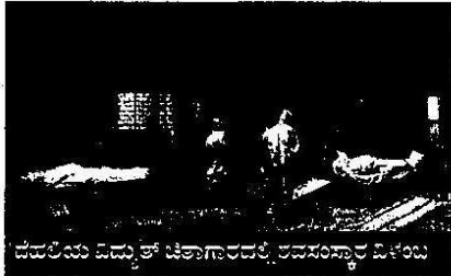
ದೆಹಲಿಯ ವಿದ್ಯುತ್ ಚಿತಾಗಾರದಲ್ಲಿ ಶವಸಂಸ್ಕಾರ ವಿಳಂಬ