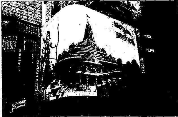
ನ್ಯೂಯಾರ್ಕ್ ನ ಟೈಮ್ಸ್ ಸ್ಕ್ವೇರ್‌ನಲ್ಲಿ ಪ್ರದರ್ಶನಗೊಂಡ ರಾಮಮಂದಿರ.

ವಾಷಿಂಗ್ಟನ್: ರಘುರಾಮನ ಮಂದಿರ ನಿರ್ಮಾಣಕ್ಕೆ ಅಡಿಗಲ್ಲು ಹಾಕುವ ಗಳಿಗೆಯನ್ನು ಬರೀ ಭಾರತದಲ್ಲಿ ಮಾತ್ರವಲ್ಲ, ವಿಶ್ವದ ಮೂಲೆಮೂಲೆಯಲ್ಲಿ ಸಂಭ್ರಮಿಸಲಾಗಿದೆ. ಅಮೆರಿಕದಲ್ಲೂ ಈ ಸಂಭ್ರಮ ಸ್ವಲ್ಪ ಜಾಸ್ತಿಯೇ ಇತ್ತು. ಕೊರೊನಾ ಇರುವ ಕಾರಣ ಸಾರ್ವಜನಿಕ ಸಭೆಗಳು ನಡೆಯಲಿಲ್ಲ. ಬಹುತೇಕರು ತಮ್ಮತಮ್ಮ ಮನೆಗಳಲ್ಲಿ ದೀಪ ಹಚ್ಚಿ ರಾಮಪೂಜೆ ಮಾಡಿದರು. ವಿಶೇಷವೆನಿಸಿದ್ದು ನ್ಯೂಯಾರ್ಕ್ ನ ಟೈಮ್ಸ್ ಸ್ಕ್ವೇರ್‌ನಲ್ಲಿ ಹಾಕಲಾಗಿದ್ದ ಬೃಹತ್ ಪರದೆ. ಅದರಲ್ಲಿ ರಾಮನ ಚಿತ್ರಗಳು, ಆಯೋಧ್ಯೆ ರಾಮಮಂದಿರದ ಚಿತ್ರಗಳು ಮೂಡಿ ಬರುತ್ತಿದ್ದವು. ಸಂಭ್ರಮಾಚರಣೆಯಲ್ಲಿ ವಿಶ್ವ ಹಿಂದೂ ಪರಿಷತ್‌ನ