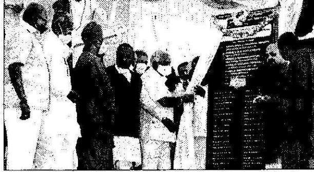
ಹರಿಹರ: ಕಾಗಿನೆಲೆ ಕನಕ ಗುರುಪೀಠದ ಶಾಖಾ ಮಠದಲ್ಲಿ ಮುಖ್ಯಮಂತ್ರಿ ಬಿ.ಎಸ್. ಯಡಿಯೂರಪ್ಪ ನೂತನ ಕಟ್ಟಡಗಳನ್ನು ಲೋಕಾರ್ಪಣೆ ಮಾಡಿದರು.