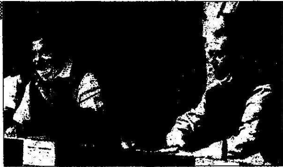
ಕೇಂದ್ರ ಸಚಿವರಾದ ನಿತಿಶ್ ಗಡ್ಕರಿ, ಪುನಃ ಜಾವದೇಕರ್ ಸುದ್ದಿಗೋಷ್ಠಿಯಲ್ಲಿ ಸಂಪುಟ ನಿರ್ಧಾರ ಪುನಃ ಪರಿಶೀಲಿಸಿದರು.

ಅವರ ಸಮಸ್ಯೆಗಳಿಗೆ ಪರಿಹಾರ ಒದಗಿಸುವ ಯೋಜನೆ ನಿರ್ವಹಿಸಲು ವೆಬ್ ಪೋರ್ಟಲ್ / ಮೊಬೈಲ್ ಅಪ್ಲಿಕೇಷನ್ ಅಭಿವೃದ್ಧಿಪಡಿಸಲಾಗುತ್ತಿದೆ. ಇದರಿಂದ ಹಣಕಾಸು ವ್ಯವಸ್ಥೆಯಲ್ಲಿ ಅವರನ್ನು ತೊಡಗಿಸಲು ಸಹಕಾರಿಯಾಗಲಿದೆ.