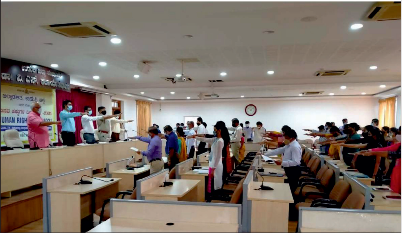
ದಿನಾಂಕ: 10/12/2021 ರಂದು ಉಡುಪಿ ಜಿಲ್ಲೆಯಲ್ಲಿ ಮಾನವ ಹಕ್ಕುಗಳ ದಿನಾಚರಣೆಯ ಸಂದರ್ಭದಲ್ಲಿ ಅಲ್ಲಿನ ಅಧಿಕಾರಿಗಳು ಹಾಗೂ ಸಿಬ್ಬಂದಿಗಳು ಮಾನವ ಹಕ್ಕುಗಳ ಪ್ರತಿಜ್ಞೆಯನ್ನು ಸ್ವೀಕರಿಸುತ್ತಿರುವುದು