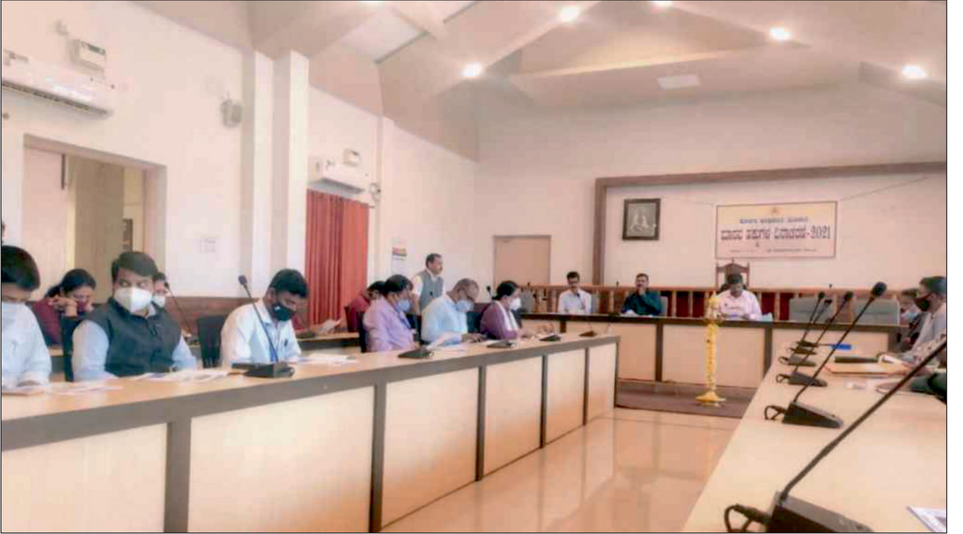
ದಿನಾಂಕ: 10/12/2021 ರಂದು ಕೊಡಗು ಜಿಲ್ಲೆಯಲ್ಲಿ ಮಾನವ ಹಕ್ಕುಗಳ ದಿನಾಚರಣೆ ಆಚರಿಸುತ್ತಿರುವುದು