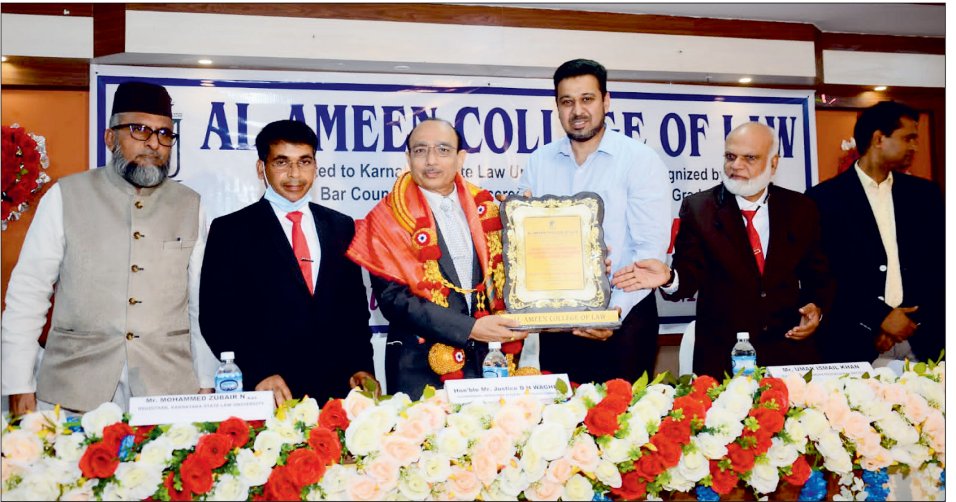
The visit of Hon'ble Chairperson to Al-Ameen College of Law, Bengaluru on the occasion of Graduation Ceremony and distribution of Distinguished Alumni Awards 2020-21 on 5th October, 2021