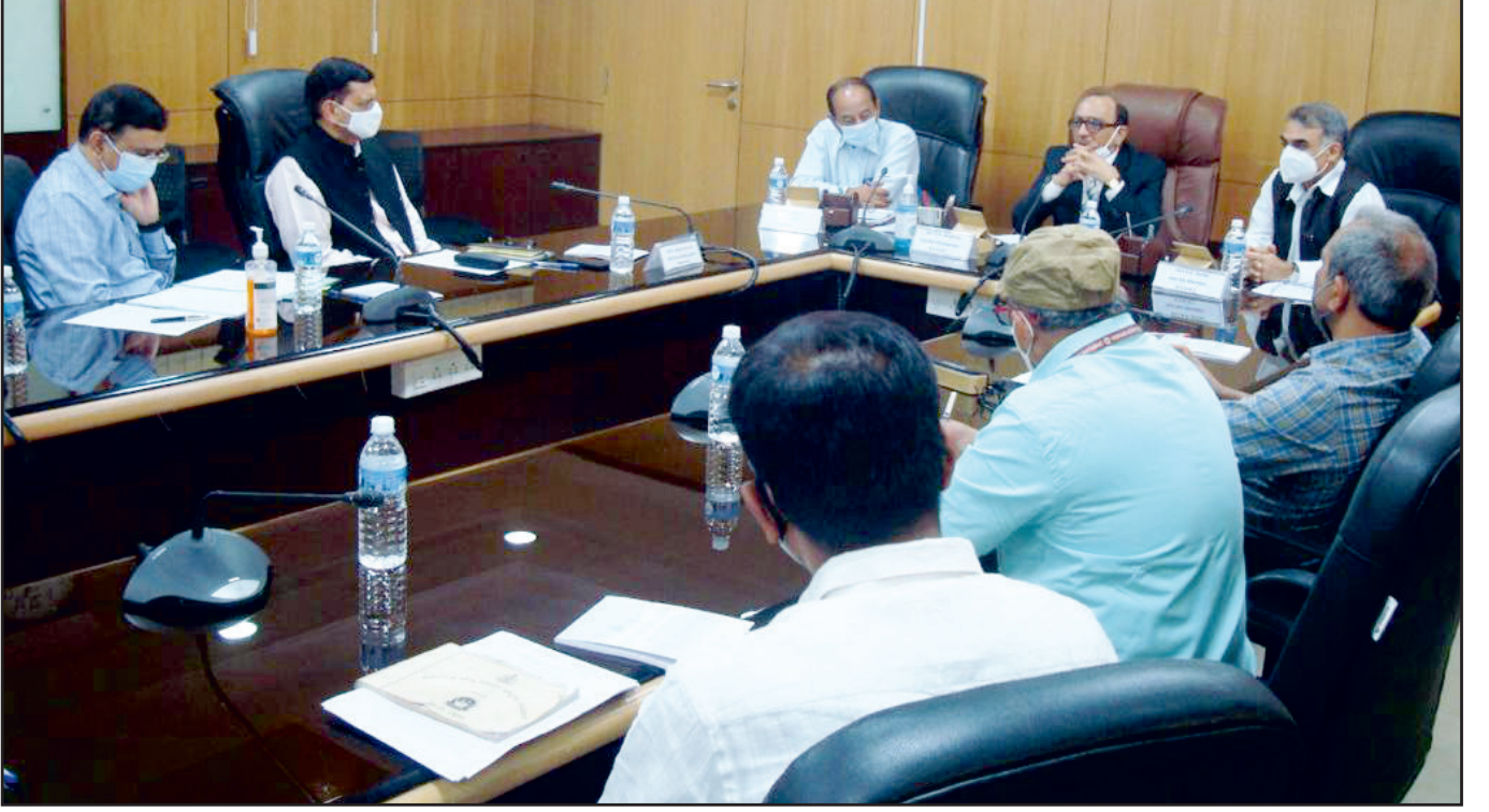
ದಿನಾಂಕ: 06/04/2021 ರಂದು ಮಾನ್ಯ ಅಧ್ಯಕ್ಷರು, ಮಾನ್ಯ ಸದಸ್ಯರುಗಳು ಮತ್ತು ಅಧಿಕಾರಿಗಳು ಒಳಾಡಳಿತ ಇಲಾಖೆಯ ಸರ್ಕಾರದ ಅಪರ ಮುಖ್ಯ ಕಾರ್ಯದರ್ಶಿ ಇವರೊಂದಿಗೆ ನಡೆಸಿದ ಸಭೆ