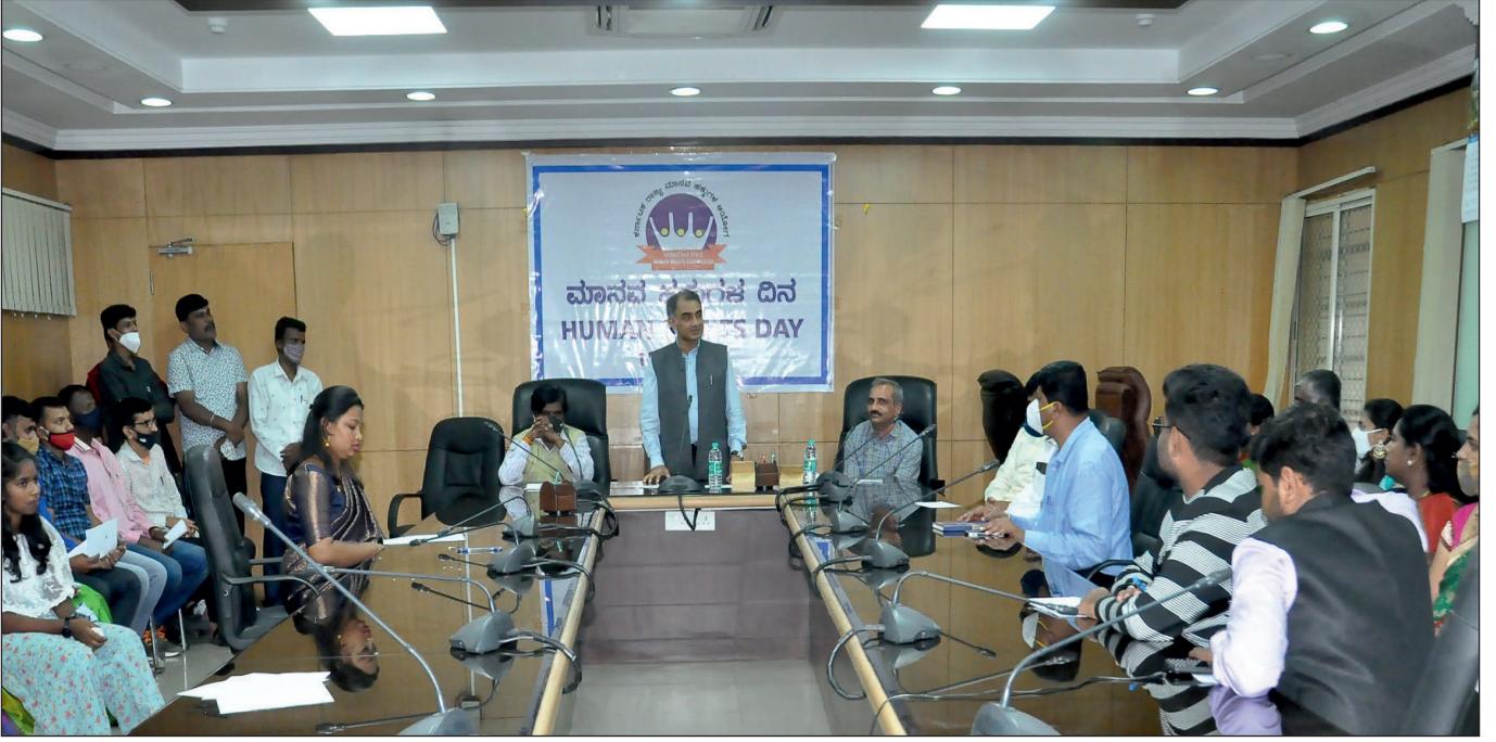
ದಿನಾಂಕ: 10/12/2021 ರಂದು ಮಾನವ ಹಕ್ಕುಗಳ ದಿನಾಚರಣೆಯ ಸಂದರ್ಭದಲ್ಲಿ ಮಾನ್ಯ ಸದಸ್ಯರು ಸಿಬ್ಬಂದಿಯನ್ನು ಉದ್ದೇಶಿಸಿ ಮಾತನಾಡುತ್ತಿರುವುದು