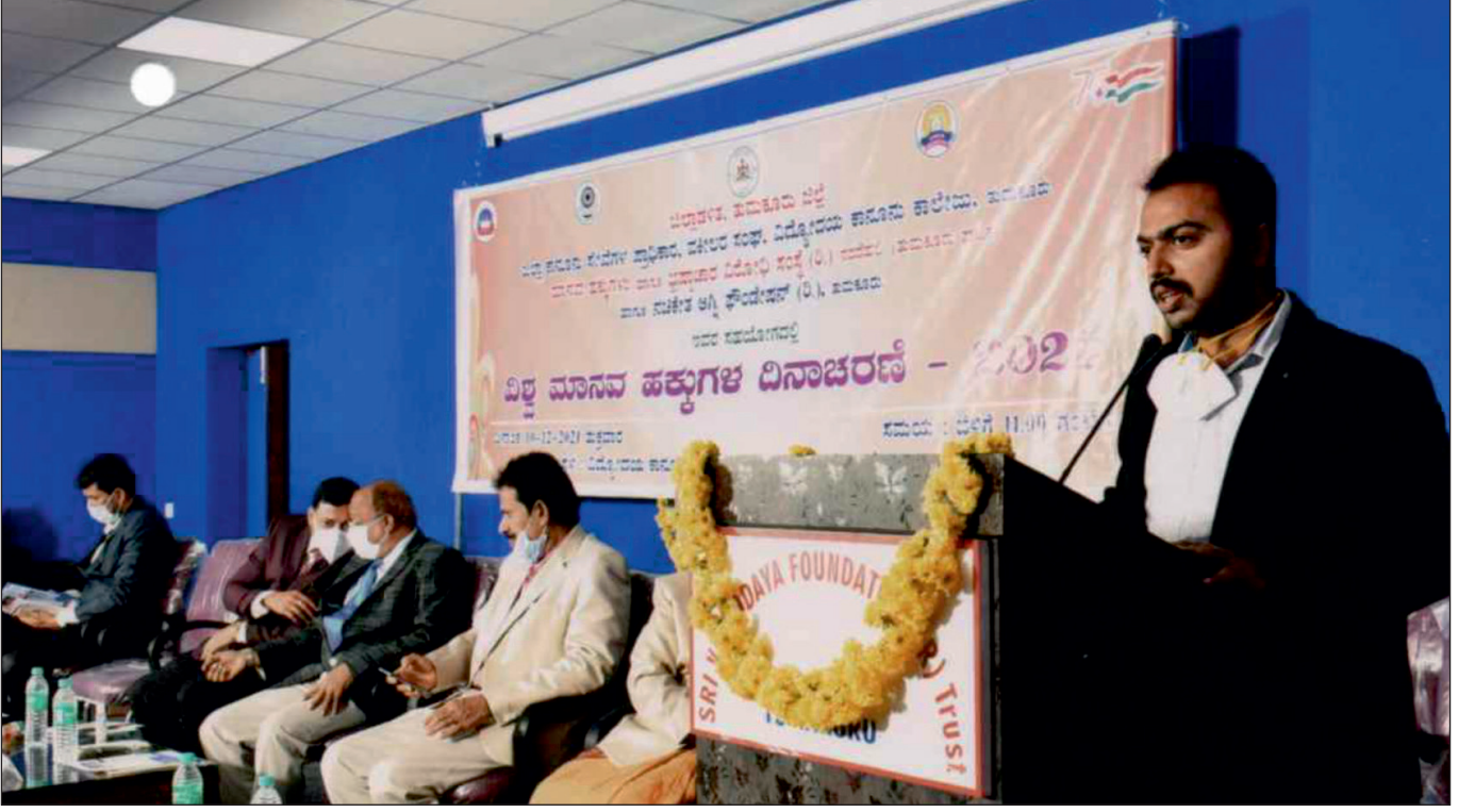
ದಿನಾಂಕ: 10/12/2021 ರಂದು ತುಮಕೂರು ಜಿಲ್ಲೆಯಲ್ಲಿ ಮಾನವ ಹಕ್ಕುಗಳ ದಿನಾಚರಣೆ ಆಚರಿಸುತ್ತಿರುವುದು