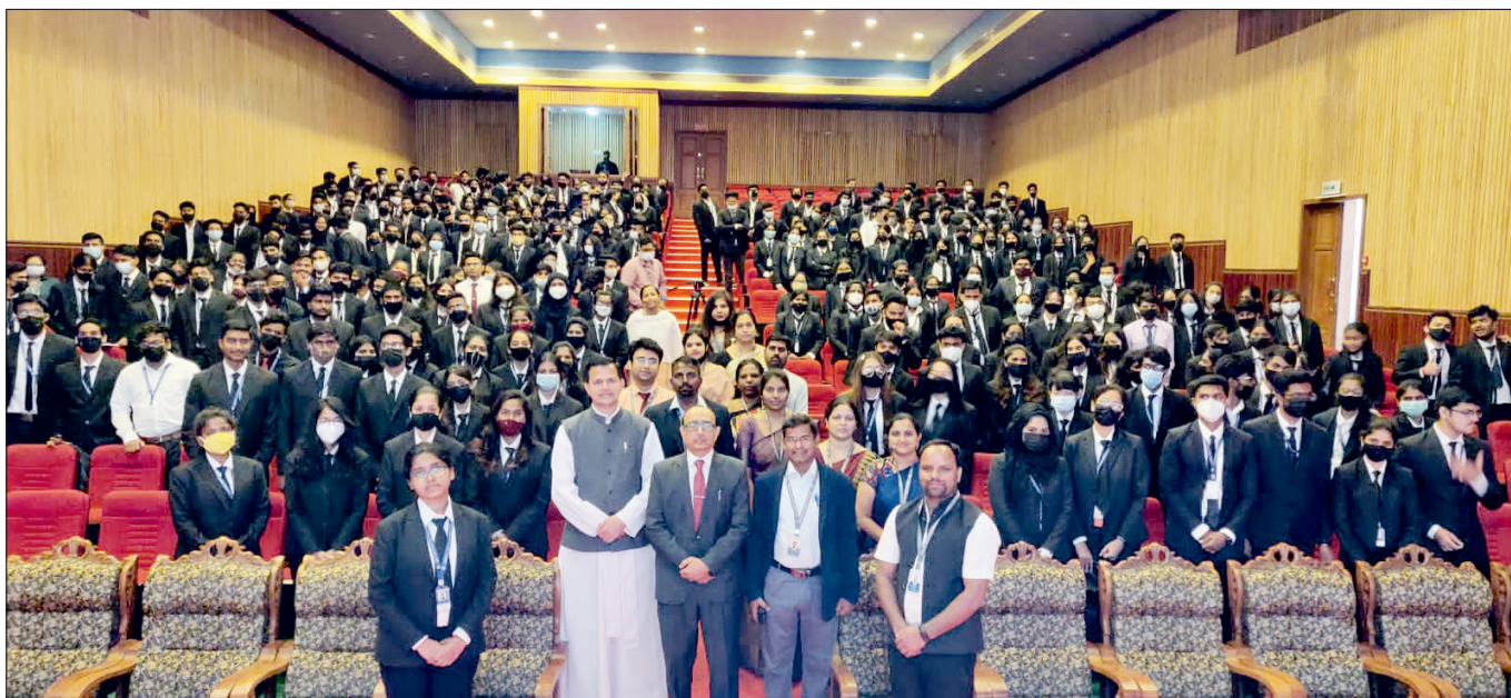
The visit of Hon'ble Chairperson to Kristu Jayanthi Law College, Bengaluru on the occasion of National Webinar on "Evolving Constitutional Relations between the Legislature, the Executive and the Judiciary" on 18th March, 2022